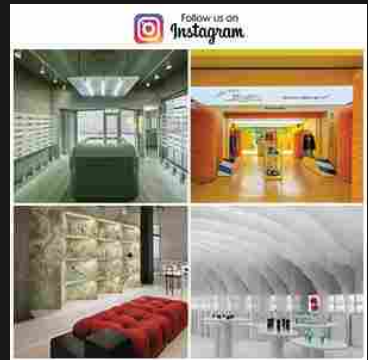
AN shopfitting magazine